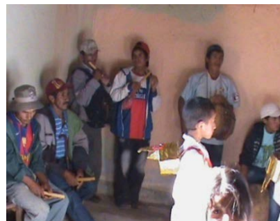
Foto 5. Músicos tocando

Mi esposo toca carrizo desde los 14 años, lo viéaste tocaban bien bonito por eso es que lo llevaban por todos los caseríos cercanos a tocar. Él fue uno de los primeros por aquí en tocar carrizo lo llevaban cuando había fiestas o había una invitación del público.