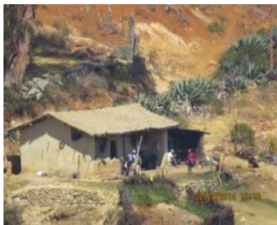
Foto 2. Modelo de vivienda Sta Úrsula