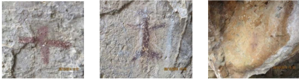
Fotos 12, 13 y 14. Pinturas rupestres