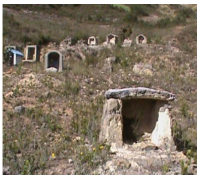
Foto 8 Vista Cementerio Santa Úrsula