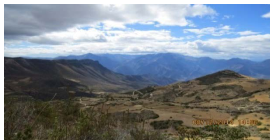
Foto 1. Vista Panorámica de Santa Úrsula

La Comunidad de Santa Úrsula pertenece al distrito de Sitacocha y en ella aún se pueden apreciar vestigios de la cultura de sus antepasados como sus conocimientos y prácticas en agricultura; aún sus formas de siembra y cosecha son regidas por la luna, meses de lluvia y un aspecto que merece considerar es la no utilización de insecticidas, lo que denota el respeto a la tierra.