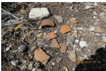
Foto 9. Restos de cerámica

Entre los restos y vestigios que aún se pueden observar en la comunidad, se encuentran los siguientes lugares: