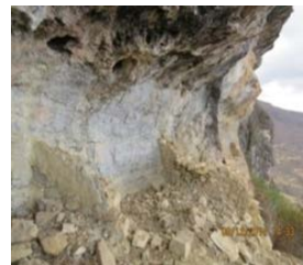
Fotos 10 y 11. Construcciones en la peña.

Pero la más sorprendente es que hay una cueva en la que se encuentran muestras de pintura rupestre tal como se muestra en las fotografías y restos de lo que podría haber sido un cementerio, por la presencia de abundantes restos de huesos humanos.