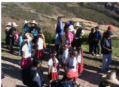
Foto 4. Danza recibiendo al santo patrón

Folklor, Costumbres y tradiciones. Entre su folklor, costumbres y tradiciones practicadas en la Comunidad de Santa Úrsula se encuentran: