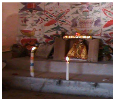
Foto 3. Imagen San Antonio de Padua