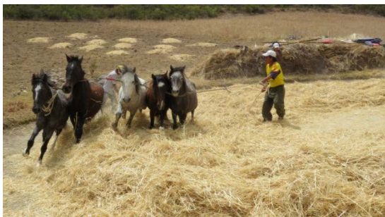
Foto 7. La trilla

La trilla. Es parecida a la minga, esta actividad empezó hacerse por la poca producción de los terrenos y por la baja economía, se realiza la trilla, no se arma barda, las bestias entran atadas y no se grita, pero se atiende a los asistentes, en esta actividad los participantes ganan Ayni, pues luego les devolverán el trabajo cuando ellos realicen sus mingas.